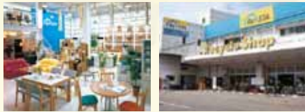
広友グループのリサイクルショップ「Re-STATION」